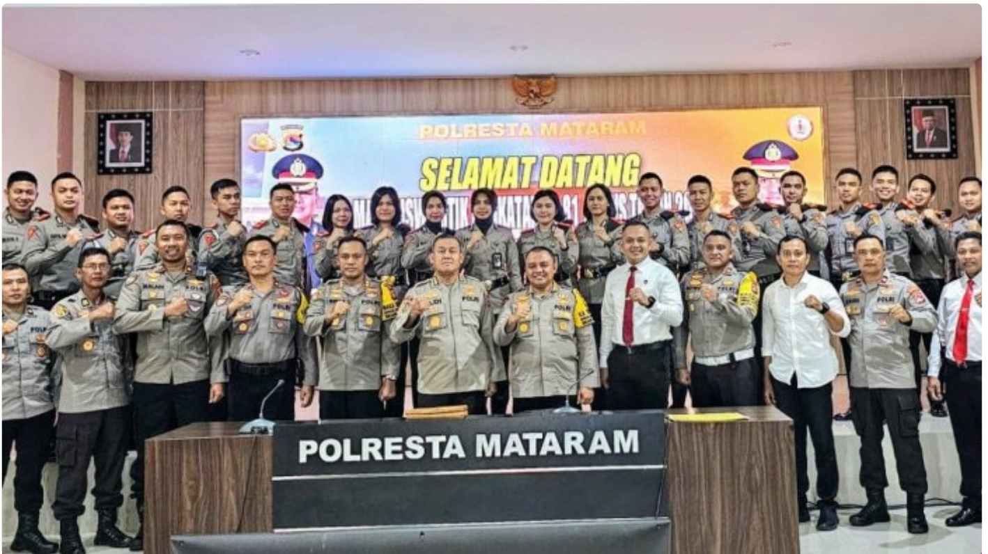
Kapolresta Mataram dan segenap PJU bersama Mahasiswa STIK / PTIK pada acara Penyambutan di Gedung Wira Pratama Polresta Mataram, (17/03/2024)

Mataram NTB - Sebanyak 24 Siswa Sekolah Tinggi Ilmu Kepolisian (STIK) / Perguruan Tinggi Ilmu Kepolisian (PTIK) Lemdiklat Polri Angkatan 81 hadir di wilayah hukum Polresta Mataram dalam rangka pelaksanaan tugas pendidikan yakni Kegiatan Pengabdian masyarakat STIK / PTIK di wilayah Hukum Polresta Mataram.